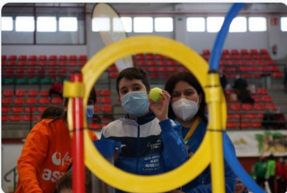
Globalcaja y 9 más 6 8

FECAM @fecamclm · 17 mar. Ya tenemos los mejores resúmenes en fotos y vídeo del 12º Campeonato Regional de Pruebas Motrices "Juntos lo logramos" Prepara unas 🥪 palomitas y un refresco 🥤, y a disfrutar. vimeo.com/688836611 flic.kr/s/aHBqjzFYav