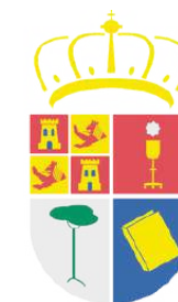
DIPUTACIÓN PROVINCIAL DE CUENCA