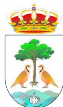
Ayuntamiento de Las Pedroñeras